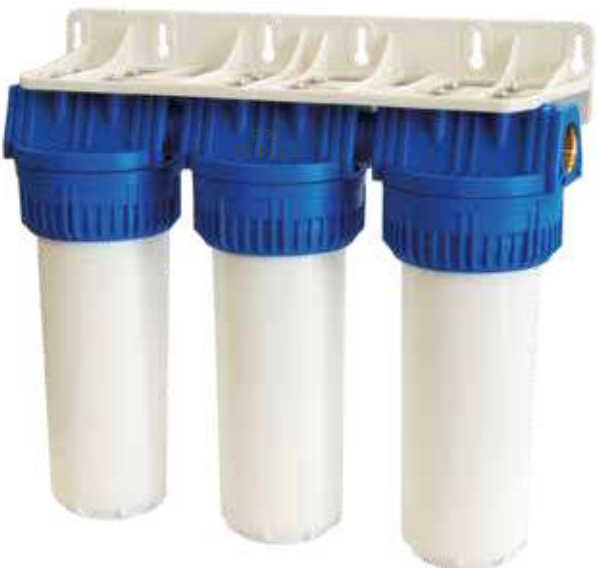
Contenitore per cartucce serie FP3 Triplex testa inserto ottone vaso opaco bianco FP2 Triplex filter cartridge housings with brass inserts and opaque white sump