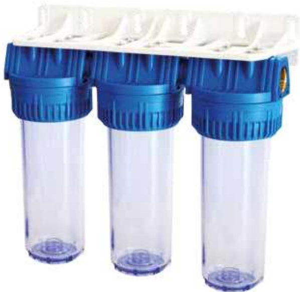
Contenitore per cartucce serie FP3 Triplex testa inserto ottone vaso SAN trasparente FP3 Triplex filter cartridge housing with brass inserts and transparent SAN sump