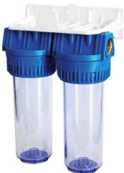
Contenitore per cartucce serie FP3 Duplex testa inserto ottone vaso SAN trasparente FP3 Duplex filter cartridge housing with brass inserts and transparent SAN sump