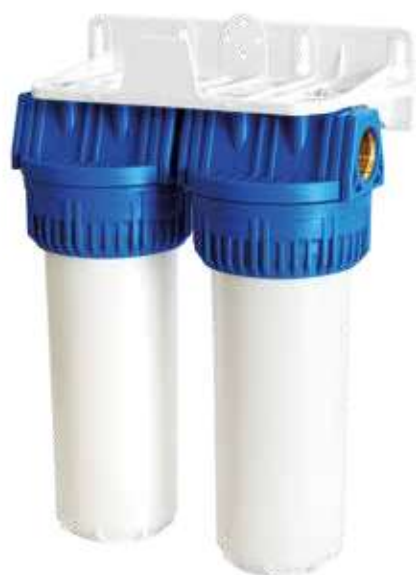
Contenitore per cartucce serie FP3 Duplex testa inserto ottone vaso opaco bianco FP3 Duplex filter cartridge housings with brass inserts and opaque white sump