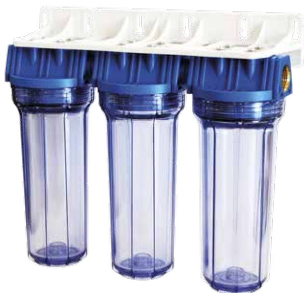
Contenitore per cartucce serie FP2 Triplex testa inserto ottone vaso SAN trasparente FP2 Triplex filter cartridge housings with brass inserts and transparent SAN sump