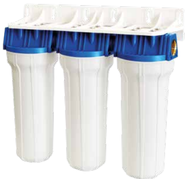
Contenitore per cartucce serie FP2 Triplex testa inserto ottone vaso opaco bianco FP2 Triplex filter cartridge housings with brass inserts and opaque white sump