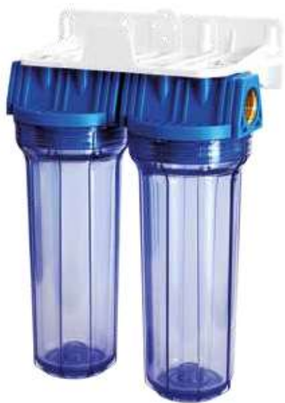
Contenitore per cartucce serie FP2 Duplex testa inserto ottone vaso SAN trasparente FP2 Duplex filter cartridge housings with brass inserts and transparent SAN sump