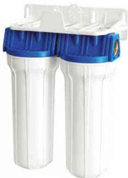
Contenitore per cartucce serie FP2 Duplex testa inserto ottone vaso opaco bianco FP2 Duplex filter cartridge housings with brass inserts and opaque white sump