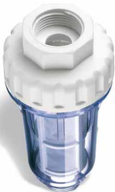
Contenitori per cartucce aquanet testa bianca vaso trasparente Aqua net cartridge filter housing with white head, transparent sumps