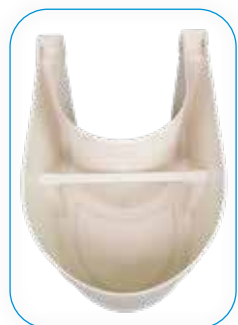
Versione standard. Standard version.