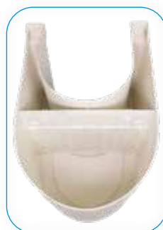
Versione a richiesta con paratia (PK). On request version with partition grid (PK).