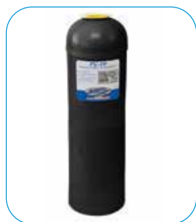
Bombola VTR. Pressure vessel VTR.